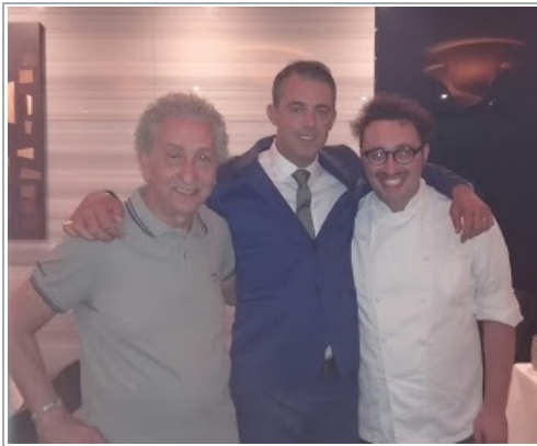
Una immagine dell'incontro di ieri. ndr.

Publicato da La Gazzetta Meridionale ~ di martedì 26 luglio 2016 ~ 0 commenti